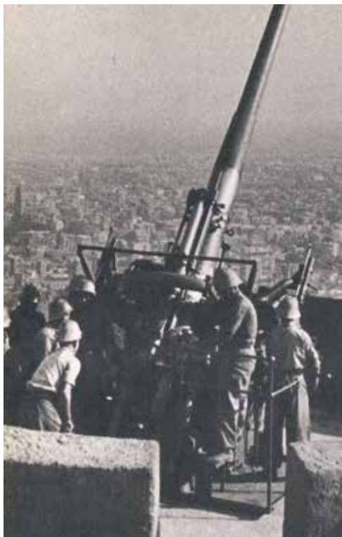
Un dels canons del Turó amb els seus servidors.