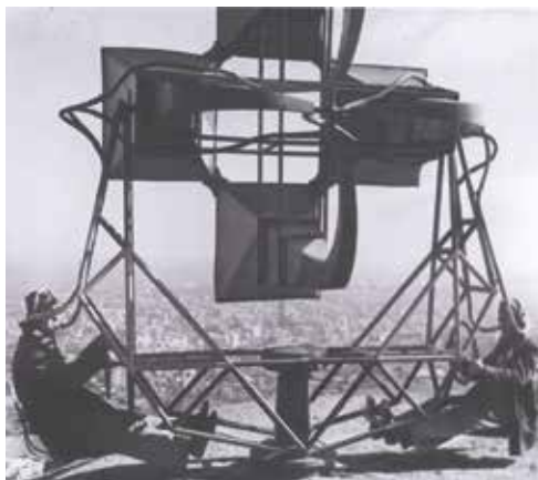
Fonolocalitzador per detectar el so dels avions, BNE.

Des del mes de novembre del 1937, Barcelona, que havia reforçat el seu paper econòmic, era, a més, la capital política republicana, amb la seu dels tres governs: el de l'Estat, el del País Basc i el de la Generalitat. La ciutat es va convertir llavors en un objectiu clau per a l'aviació feixista i va haver d'organitzar-se. Fàcil de localitzar, per la seva característica façana litoral, les autoritats van decidir articular elements defensius per aturar l'amenaça marítima i aèria mitjançant la defensa passiva, centrada en la protecció eficaç dels ciutadans, i la defensa activa, destinada a neutralitzar els bombardeigs enemics. Per a la localització dels enemics es disposava d'elements com ara els centres d'observació i radioescolta, els projectors o reflectors d'il·luminació i els aparells fonolocalitzadors, antecedents dels radars, no gaire precisos. Quant a la neutralització dels atacs enemics, se n'encarregaven els canons antiaeris i els avions de caça.