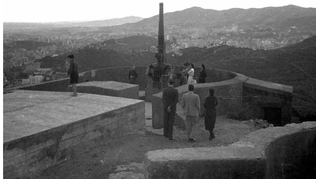
Els canons de la bateria, un cop acabada la guerra, c. 1939-1942

Entre el 25 i el 26 de gener del 1939, en el moment de la retirada, l'exèrcit republicà va inutilitzar les peces d'artilleria, que acabada la guerra van romandre durant un temps al cim del Turó.