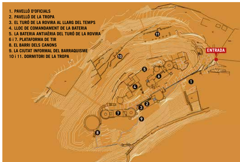
Esquema de l'espai patrimonial.