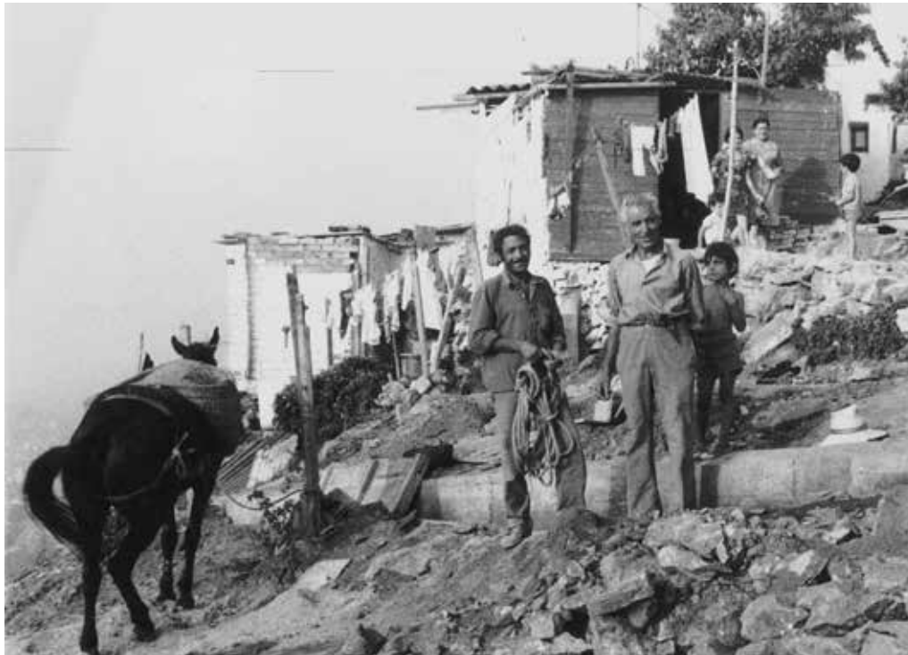
Veïns de Los Cañones preparant el terreny per aixecar-hi una barraca, c. 1955.

Dalt de tot del Turó de la Rovira, totes les construccions de la bateria antiaèria en desús no van trigar a ser reutilitzades, i es va anar formant un nucli nou d'habitatges informals. El nom popular de Los Cañones remetia de manera inequívoca a l'ús militar de l'emplaçament durant la Guerra Civil. Els habitants van disposar les barraques de manera notablement ordenada en relació amb l'eix central de la bateria, convertit en carrer principal, i van agençar-ne l'entorn per adaptar-se a la complicada orografia del terreny. La fesomia del conjunt responia a les pautes de l'arquitectura tradicional d'Andalusia, d'on provenien molts dels residents.