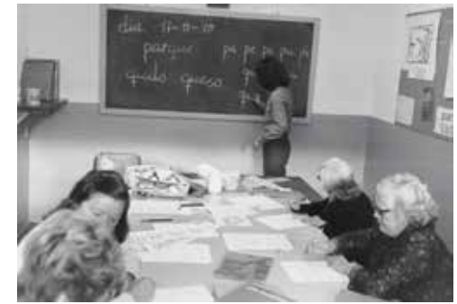
Aula de l'escola d'adults, 1980, Arxiu Paco González.