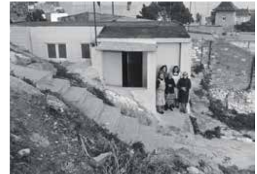
Alumnes davant de l'escola d'adults, 1980, Arxiu Paco González.

El barri, caracteritzat per forts vincles organitzatius de lluita col·lectiva, va arribar a tenir prop de 110 barraques i uns 600 habitants. Un dels problemes principals va ser el proveïment d'aigua. No és gens estrany, doncs, que, arran de la instal·lació el 1963 del dipòsit circular de la Societat General d'Aigües de Barcelona dalt del Turó, algú trobés la manera de connectar-hi una font improvisada, encara visible.