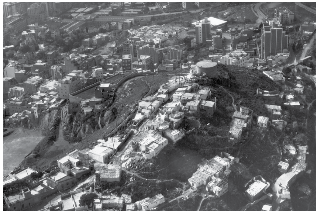
Vista aèria, 1972.

Detall panoràmic de la ciutat des del Turó de la Rovira, 2011.